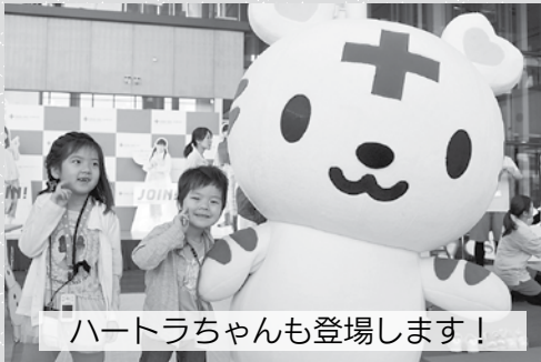
ハートラちゃんも登場します！

9月1日は「防災の日」です。平時における日本赤十字社秋田県支部の防災・減災への取り組みを紹介し、県民の皆様へ理解を深めていただくことを目的として開催されます。