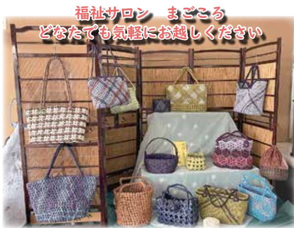
福祉サロン まごころ どなたでも気軽にお越しください