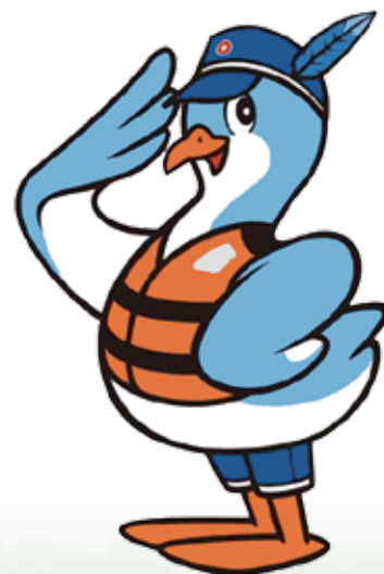
水難救済会 きゅうすけくん