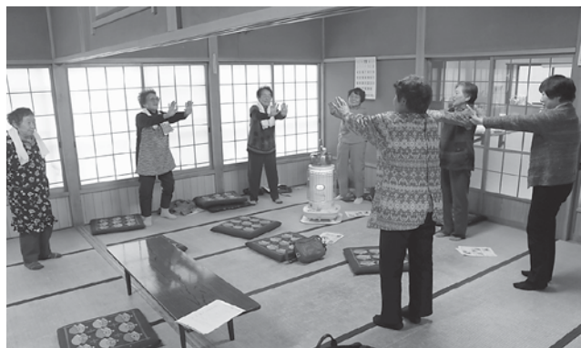
西馬音内 中村集落「スマイルの会」