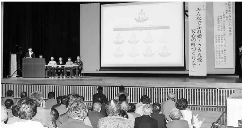
→ 体験発表のようす

式典最後には、地域おこし協力隊と羽後明成小学校の皆さんで取り組んでいる活動を「取材・編集・発信」超ローカルな視点だから気づいた、新しい価値観」と題して、それぞれが活動を通して感じた事等を交えながら発表していただきました。