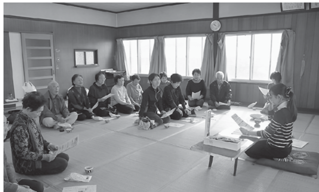
新成 上・下郡集落「郡山サロン」