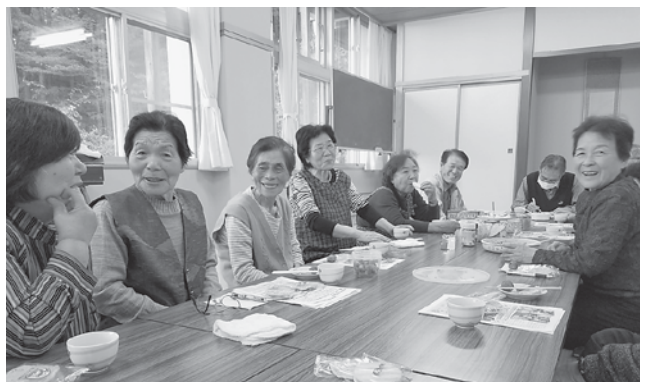
田代「上到米つどいのサロン」