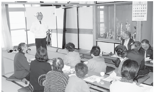
明治 堀内集落「堀内地区福祉交流推進会」